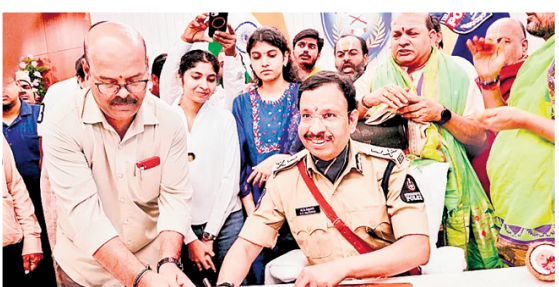
సవాళ్ల నడుమ హైదరాబాద్ సిపిగా