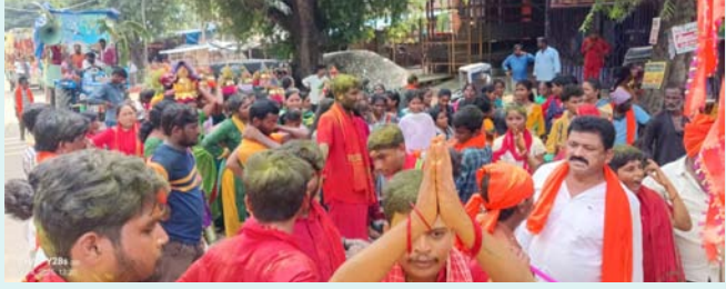
చర్ల, అక్టోబర్ 04 (డిడి 9 వార్త)

ఈరోజు చర్ల గ్రామంలో చిన్న ఇంద్రకీలాది ఆలయం, త్రికూట దేవాలయం, శివాలయం, గొల్లకట్ట మండపం లో కొలువుదీరిన దుర్గమ్మ వారు నవరాత్రులు ముగించుకొని శోభాయ మానంగా యాత్రకు బయలుదేరారు ఈ వేడుకల్లో గ్రామంలోని అశేష భక్తజనం, భవానీలు, చిన్నారులు, మహిళలు పెద్ద ఎత్తున పాల్గొని వారి అటపాటలతో, నృత్యాలతో అమ్మవారి పై ఉన్నతమ భక్తిని చాటుకున్నారు. ఈరోజు చర్ల ఏడులన్నీ డీజేలతో, డప్పు వాయిద్యాలతో మారుమ్రోగాయి. విచిత్ర వేషధారణలో కళాకారులు పిల్లలను, పెద్దలను అందరిని ఆలరించారు. అన్నీ ఆలయ కమిటీల సభ్యులు ఈ వేడుకలను అత్యంత ఉత్సాహంతో, భక్తిశ్రద్ధలతో ఘనంగా నిర్వహించారు.