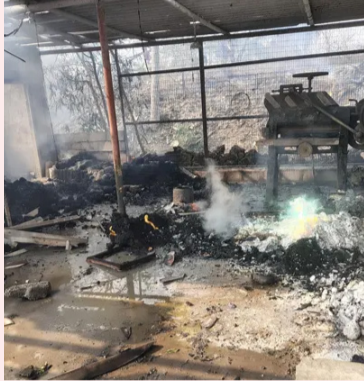
కూటుంబ సభ్యులు, బంధువులు కన్నీరుమున్నీరయ్యారు. గ్రామంలో విషాద ఛాయలు కమ్ముకున్నాయి. బాధిత కుటుంబాల ఇళ్ల వద్ద శోకసంద్రం కనిపిస్తోంది.

దూరం వరకు వినిపించినట్లు సమాచారం. సమీప గ్రామంలోని ఓ ప్రైవేట్ పాఠశాల భవనం స్ట్రాబేకు కూడా పగుళ్లు పచ్చినట్లు తెలిసింది. సమాచారం అందుకున్న వెంటనే అగ్నిమాపక సిబ్బంది రెండు ఫైర్ ఇంజిన్లతో ఘటనాస్థలికి చేరుకున్నారు. గంటలపాటు శ్రమించి మంటలను అదుపులోకి తీసుకువచ్చారు. పోలీసులు ప్రాంతాన్ని చుట్టుముట్టి సహాయక చర్యలు చేపట్టారు. గాయపడిన వారిని అంబులెన్సుల ద్వారా సమీప ప్రభుత్వ ప్రైవేట్ ఆసుపత్రులకు తరలించారు. కొందరి పరిస్థితి విషమంగా ఉన్నట్లు వైద్యులు తెలిపారు.