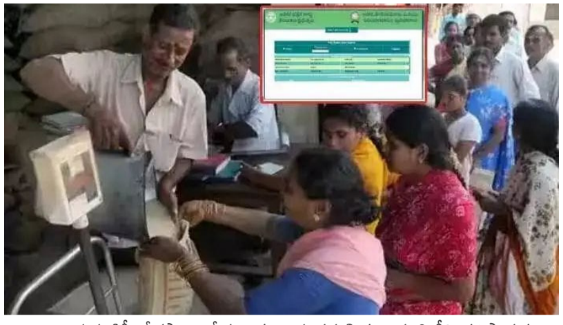
అంశాలు ఉన్నప్పటికీ.. క్షేత్రస్థాయిలో ప్రజలకు ఎటువంటి ఇబ్బంది కలగకుండా ఈ కార్యక్రమాన్ని విజయవంతం చేయడంపై ప్రభుత్వం దృష్టి సారించింది. ఈ నిర్ణయం అమలులోకి వస్తే ఏప్రిల్ నెలలోనే పేద కుటుంబాల ఇళ్లలో బియ్యం నిల్వలు నిండుగా ఉంటాయి. తెలంగాణ ప్రభుత్వం

పౌర సరఫరాల శాఖ ప్రస్తుతం లోతుగా సమీక్షిస్తోంది. గత ఏడాది వర్షాకాలంలో ఇలాగే మూడు నెలల బియ్యాన్ని ఒకేసారి ఇచ్చినప్పుడు రేషన్ డీలర్లు, లబ్ధిదారులు కొన్ని ఇబ్బందులు ఎదుర్కొన్నారు. ప్రధానంగా రేషన్ దుకాణాల్లో మూడు నెలల స్టాక్ను భద్రపరచడానికి సరిపడా స్థలం లేకపోవడం డీలర్లకు పెద్ద సమస్యగా మారింది. మరోవైపు.. బయోమెట్రిక్ విధానంలో ఒకేసారి మూడు నెలల కోటా తీసుకోవాలంటే లబ్ధిదారులు ఈపోస్ యంత్రంపై మూడు సార్లు వెలిముద్రలు వేయాల్సి ఉంటుంది. సర్వే సమస్యలు తలెత్తిన ఒక్కో కార్డు హార్డు కాపీని 15 నుండి 20 నిమిషాల సమయం పట్టే అవకాశం ఉంది. ఇది దుకాణాల వద్ద రద్దీకి దారి తీయవచ్చు. ఈ సాంకేతిక అడ్డంకులను అధిగమించేందుకు అధికారులు ప్రత్యేక సాఫ్ట్వేర్ అప్డేట్స్, ప్రత్యామ్నాయ మార్గాలను అన్వేషిస్తున్నారు. రవాణా ఖర్చులు తగ్గడం, హవాలీలకు పని భారం తగ్గడం వంటి సానుకూల