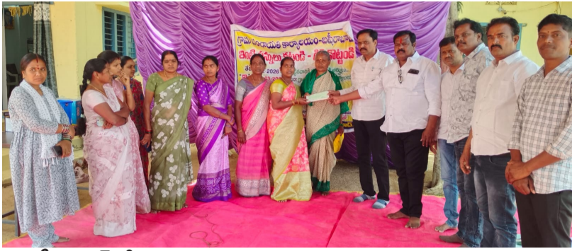
• బషీరాబాద్ లో నిధులపై చర్చ.. పన్ను చెల్లింపుదారులకు బహుమతులు అందజేత నిజామాబాద్ జిల్లా 04 మార్చి(డిడి9 వార్త) :