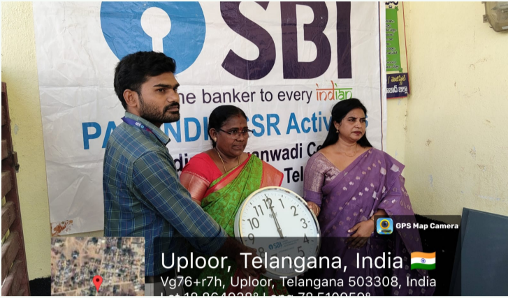
నిజామాబాద్ జిల్లా 06మార్చి(డీడీ9 వార్త) :

కమ్యూన్ పల్లి మండలం ఉప్పుర్ గ్రామంలోని అంగన్వాడీ కేంద్రాలకు ఎస్బీఐ ఛాట్ పల్లి శాఖ సామాజిక బాధ్యతగా సహకారాన్ని అందించింది. ఎస్బీఐ పాస్ ఇండియా సీఎస్ఆర్ కార్యక్రమంలో భాగంగా, తెలంగాణ రాష్ట్ర ఎస్బీఐ ఆధ్వర్యంలో చిన్నారి పిల్లల ఉజ్వల భవిత్య కోసం అవసరమైన అనేక విద్యా మరియు మౌలిక వసతుల ఉపకరణాలను అందజేశారు. ఈ సందర్భంగా అంగన్వాడీ కేంద్రాలకు ఎల్ఈడి టీవీలు, డ్రస్ కక్కుర్లు, వాటర్ ఫిల్టర్లతో పాటు చిన్న పిల్లల బోజనానికి అవసరమైన స్ట్రెయిన్ చేసే స్టీల్ ఫ్లేట్లు, గ్లాసులు ఉపకరణాలను పంపిణీ చేశారు. పిల్లల విద్యాభ్యాసానికి తోడ్పడేలా పలకలు, పుస్తకాలు మరియు