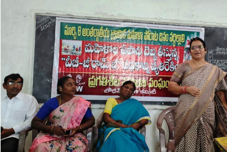
నిజామాబాద్ జిల్లా 06మార్చి(డీడీ9 వార్త) :

కనీసం మూడేళ్ల పని అనుభవం కలిగి ఉండాలి. దరఖాస్తు సమర్పించే తేదీ నాటికి అభ్యర్థి కనీసం 21 ఏళ్లు నిండి ఉండాలని పేర్కొన్నారు. ఆసక్తి కలిగిన అభ్యర్థులు ఈ నెల 15వ తేదీలోపు హైదరాబాద్లోని మల్లేపల్లి ఐటీఐ క్వారంప్ లేదా వరంగల్ ఐటీఐ ఐటీఐ సర్టిఫికేట్ ఉన్న రిజిస్టర్ డిప్యూటీ డైరెక్టర్ (అప్రెంటిస్) కార్యాలయాల నుండి దరఖాస్తులను పొంది, పూర్తి చేసిన పత్రాలను నిర్దేశ గడువులోగా అదే కార్యాలయాల్లో సమర్పించాల్సి ఉంటుంది. మరిన్ని వివరాల లేదా సందేహాల నివృత్తి కోసం సంబంధిత కార్యాలయ అధికారులను నేరుగా సంప్రదించవచ్చని ప్రిన్సిపాల్ సూచించారు.