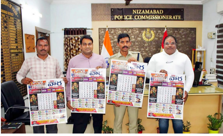
నిజామాబాద్ జిల్లా 06మార్చి(డీడీ9 వార్త) :