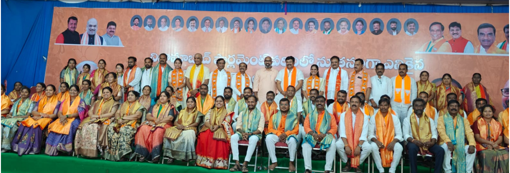
నిజామాబాద్ జిల్లా 06మార్చి(డీడీ9 వార్త) :