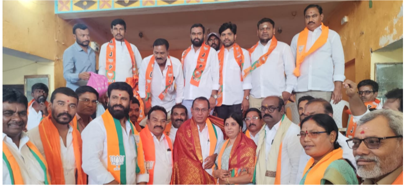
బీజేపీలోకి 200 మందికి పైగా నాయకులు, యువకుల చేరిక డిడి9 వార్త గుడిహత్తూర్: