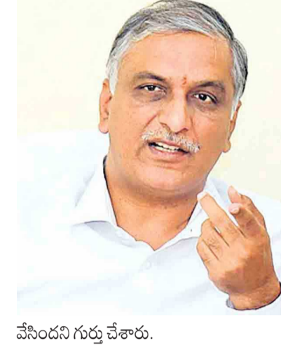
వేసిందని గుర్తు చేశారు.

రు. రేపంతో రెడ్డికి విమర్శలు చేయడంపై ఉన్న దృష్టి రైతుల కష్టాల మీద లేదని అన్నారు. తో మిద్దినరేళ్ల పాలనలో అభివృద్ధి అంటే ఏమిటో చూపించామని, కానీ కాంగ్రెస్ అధికారంలోకి వచ్చాక చేసినదేమీ లేదని విమర్శించారు. హైద్రా పేరుతో, మూసీ సుందరీకరణ పేరుతో రియల్ ఎస్టేట్ వ్యాపారం కోసం పేదల ఇళ్లను కూలు తున్నారని ఆరోపించారు. రేపంతో రెడ్డిని కుంభకర్నూడితో పోల్చవచ్చని హారీశ్ రావు అన్నారు. ఎందుకంటే ఎన్నికలు రాగానే ఆయన నిద్రలేస్తారని, ఎన్నికలయ్యాక కేసీఆర్, బీఆర్ఎస్ మీద నిందలు వేయడమే రేపంతో రెడ్డికి తెలుసని అన్నారు. కరోనా సమయంలోనూ కేసీఆర్ ప్రభుత్వం రైతు బంధు