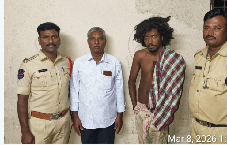
Mar 8, 2026 1: