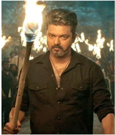
లోలో కూడా సాధ్యమయ్యేలా కనిపించడం లేదు. మరోవైపు విజయ్ పుట్టినరోజుకూ దీన్ని ప్రేక్షకుల ముందుకు తీసుకురావాలనే ఆలోచన ఉన్నట్లు కూడా వార్తలు వస్తున్నాయి. జూన్ 22 ఆయన పుట్టినరోజు కావడంతో జూన్ 18న దీన్ని రిలిజ్ చేయాలని భావిస్తున్నట్లు సమాచారం.

విజయ్ హీరోగా తెరకెక్కిన 'జన నాయగన్' సినిమా విడుదలకు చిక్కులు తప్పడం లేదు. జనవరిలో ప్రేక్షకుల ముందుకు రావాల్సిన ఈ చిత్రానికి చట్టపరమైన సమస్యలు ఎదురుకావడంతో చివరి నిమిషంలో వాయిదా పడింది. ప్రస్తుతం దీన్ని రివైజింగ్ కమిటీకి పంపిన విషయం తెలిసింది. సెన్సార్ సర్టిఫికేట్ కోసం నేడు ఈ సినిమాను సీబీఎఫ్సీ రివైజ్ కమిటీ వీక్షించాల్సి ఉంది. అయితే, కమిటీలో ఓ సభ్యుడి అనారోగ్య కారణంగా చివరి నిమిషంలో స్క్రీనింగ్ వాయిదా పడింది. తదుపరి తేదీ కూడా చెప్పకపోవడంతో విడుదల మరింత ఆలస్యమయ్యే సూచనలు కనిపిస్తున్నాయి.