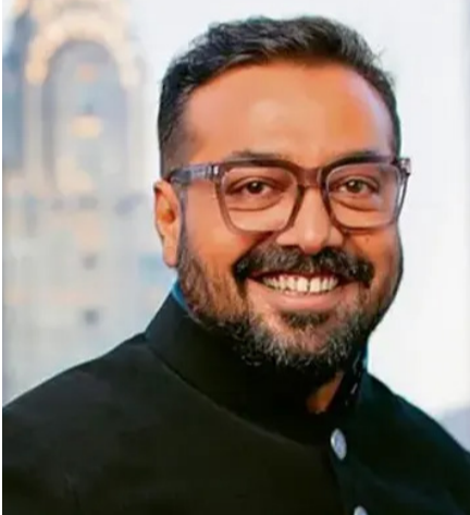
వచ్చాయి. దీనిపై ఆయన గతంలో సూ స్పందించారు. తన సినిమాల కన్నా తన పేరుతో కూడిన ప్రచారంపై ఆసక్తి చూపించడాన్ని తప్పుబట్టారు.

ప్రపంచవ్యాప్తంగా సంచలనం సృష్టించిన ఎవ్ స్టీన్ ఫైల్స్ లో అనురాగ్ కశ్యప్ పేరు ఉందని వార్తలు వచ్చిన విషయం తెలిసిందే. దీనిపై ఆయన మరోసారి స్పందించారు. తనకు ఎవ్ స్టీన్ ఫైల్స్ తో సంబంధం లేదని చెప్పారు. అసలు ఆ ఈమెయిల్స్ గురించి తనకు తెలియదని, తాను ఎప్పుడూ బీజింగ్ కు వెళ్లలేదని కశ్యప్ స్పష్టం చేశారు. ఆ వత్తాల్లో పేర్కొన్న వివరాలకు తనకు ఎలాంటి సంబంధం లేదని, అసలు తన పేరు అందులోకి ఎలా వచ్చిందో కూడా తనకు తెలియదన్నారు. తాను వైనా వెళ్లాలని.. కానీ, అది 2014కు ముందు అని తెలిపారు. అది కూడా సినిమా లాకేషన్ లో కోసం వెళ్లి నట్లు చెప్పారు. ఆ సమయంలో తాను ముంబయిలో తన పనిలో నిమగ్నమై ఉన్నట్లు చెప్పారు. అనవసర వివాదంలో తన పేరును లాగినట్లు తెలిపారు. ఎవ్ స్టీన్ కు సంబంధించిన ఓ ఈవెంట్ కోసం అనురాగ్ 2017లో బీజింగ్ వెళ్లారంటూ రూమర్స్