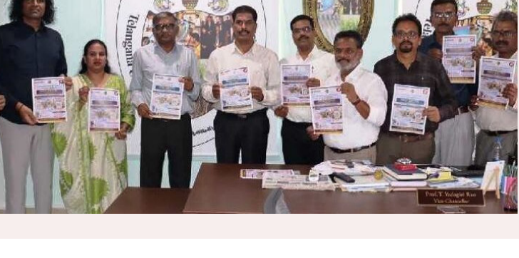
ఈ నెల 17న టీయూఎల్ మెగా జాబ్ ఫేయిర్

అవకాశాన్ని సద్వినియోగం చేసుకోవాలని పిలుపునిచ్చారు. ఈ మెగా జాబ్ ఫేయిర్ లో 500కు పైగా ప్రముఖ కంపెనీలు పాల్గొంటున్నాయని, అర్హులైన అభ్యర్థులను ఆయా సంస్థలు ఎంపిక చేస్తాయని తెలిపారు. స్టానిక విద్యార్థులకు ఉపాధి కల్పించడమే ధ్యేయంగా ఈ కార్యక్రమాన్ని నిర్వహిస్తున్నామని, ఆసక్తిగల అభ్యర్థులు తమ బయోడేటాతో హాజరు కావాలని సూచించారు. ఈ కార్యక్రమంలో విశ్వవిద్యాలయ అధికారులు, అధ్యాపకులు, ఫ్లెక్స్ మెంట్ సెల్ ప్రతినిధులు తదితరులు పాల్గొన్నారు.