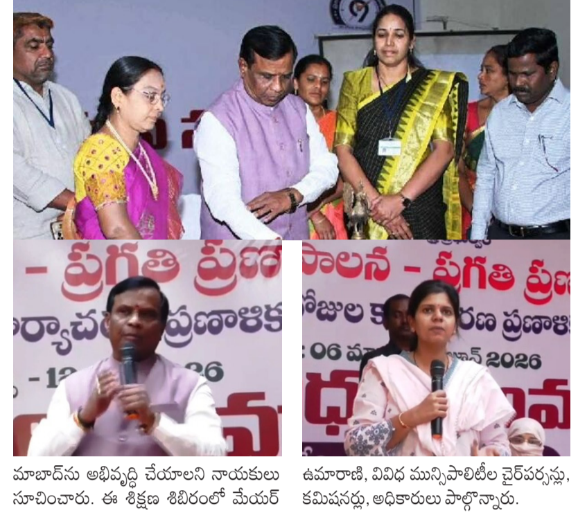
మాబాద్ను అభివృద్ధి చేయాలని నాయకులు సూచించారు. ఈ శిక్షణ శిబిరంలో మేయర్

పరిధిలోని ఆస్తులను, ట్రేడ్ లైసెన్స్లను సమర్థవంతంగా నిర్వహించి ఆదాయాన్ని పెంచుకోవాలి. రాజీవ్ గాంధీ ఆడిటోరియం వంటి ఆస్తులను ఆధునికీకరించి, ఆదాయ వనరులుగా మార్చుకోవాలి. వార్డు వారీగా సమస్యలను గుర్తించి, పక్కా ప్రణాళికతో ముందుకు సాగాలని సూచించారు. ఎమ్మెల్యే ధన్వపాల్ సూర్యనారాయణ మాట్లాడుతూ.. ప్రజలకు సేవ చేయాలనే లక్ష్యంతోనే మీరు ఎన్నికయ్యారు. ప్రభుత్వం ప్రతిష్టాత్మకంగా చేపట్టిన 99 రోజుల ప్రజాపాలన ప్రగతి ప్రణాళికను ప్రజల్లోకి తీసుకెళ్లాలి. శానిటేషన్ సమస్యలపై అధికారులు, ప్రజా ప్రతినిధులు ప్రత్యేక దృష్టి పెట్టాలి. సమస్యల పరిష్కారంలో నిర్లక్ష్యంగా వ్యవహరించే అధికారుల తీరును నా దృష్టికి తీసుకురావాలి. ప్రజా ప్రతినిధులు మున్సిపల్ కౌన్సిల్లో ఆమె, అర్బన్ ఎమ్మెల్యే ధన్వపాల్ సూర్యనారాయణతో కలిసి ప్రారంభించారు. ఈ సందర్భంగా కలెక్టర్ మాట్లాడుతూ.. ప్రజా ప్రతినిధులు కేవలం పాలనీ మేకర్లు మాత్రమే కాదు, ప్రజల సమస్యలను క్షేత్రస్థాయిలో పరిష్కరించే ఎగ్జిక్యూటివ్లు. మీ వార్డుకు మీరే సీఈవో. మీ