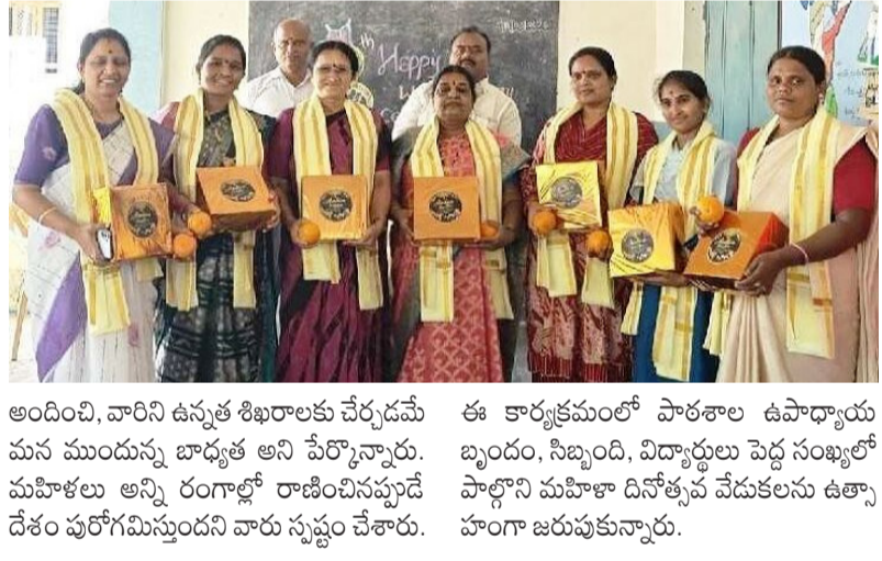
అందించి, వారిని ఉన్నత శిఖరాలకు చేర్చడమే మన ముందున్న బాధ్యత అని పేర్కొన్నారు. మహిళలు అన్ని రంగాల్లో రాణించినప్పుడే దేశం పురోగమిస్తుందని వారు స్పష్టం చేశారు.

నిజామాబాద్ జిల్లా 12 మార్చి(డీడీ9 వార్త) : జకాన్ పల్లి మండలం బాలనగర్ ప్రాథమిక స్కూల్ పాఠశాలలో అంతర్జాతీయ మహిళా దినోత్సవ వేడుకలను ఘనంగా నిర్వహించారు. ఈ సందర్భంగా పాఠశాలలో పనిచేస్తున్న మహిళా ఉపాధ్యాయులను ఘనంగా సన్మానించారు. ఈ సందర్భంగా వక్రలు మాట్లాడుతూ.. సమాజ నిర్మాణంలో మహిళల పాత్ర వెలకట్టలేనిది. అక్షర రూపంలో సమాజానికి విజ్ఞానాన్ని అందించే ఉపాధ్యాయుల సేవలు అభినందనీయమని కొనియాడారు. నేటి సమాజం మహిళా సాధికారతలక్ష్యంగా ముందుకు సాగుతోందని, ప్రతి రంగంలోనూ మహిళలు తమదైన ముద్ర వేస్తున్నారని అన్నారు. బాలికలకు సరైన విద్యను