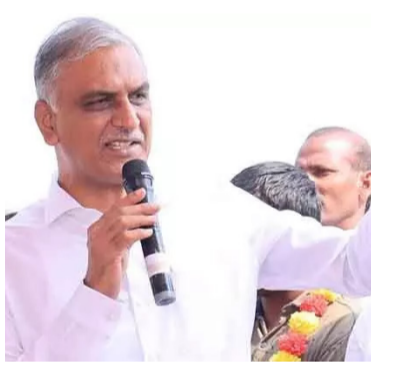
దీని ఆయన విమర్శించారు.

నిర్వహించాలని భావిస్తోంది. దీనిపై స్పందించిన హరీష్ రావు, ఆదివారం నాడు సభ పెట్టినా తమకు ఎలాంటి అభ్యంతరం లేదని స్పష్టం చేశారు. తమకు కావాల్సిందే కేవలం చర్యకు తగిన సమయం మాత్రమేనని, ప్రజల పక్షాన గతం వినిపించేందుకు తాము ఎప్పుడూ సిద్ధమని ఆయన పేర్కొన్నారు. ప్రభుత్వం మొక్కుబడిగా సమావేశాలు నిర్వహించి బడ్జెట్ ను ఆమోదించజేసుకోవాలని చూస్తోందని, దీనివల్ల ప్రజాస్వామ్య స్ఫూర్తి దెబ్బతింటుంది