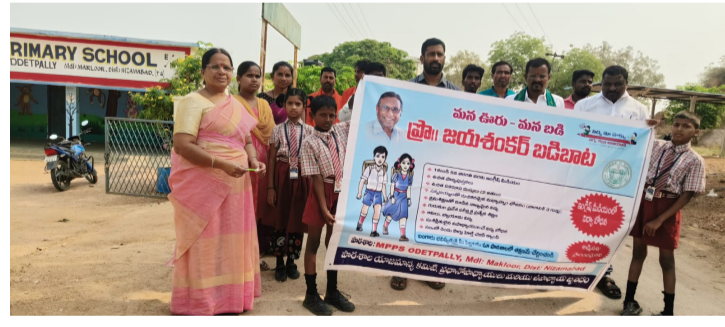
ఓట్రెట్ పల్లిలో మన ఊరు - మన బడి ప్రచారం