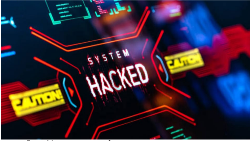
అదిలాబాద్ జిల్లా డిడి 9 వార్త స్టూన్ బ్యూరో

మనిషి ఆశాజీవి ఆశే మనిషిని ముందుకు నడిపిస్తుంది కానీ కొందరు దురాశతో అడ్డదారులు తొక్కుతున్నారు అధునిక సాంకేతికతను ఉపయోగించి డిజిటల్ మోసాలకు పాల్పడుతున్నారు బ్యాంకు ఖాతాలనుంచి డబ్బులు కొల్లగొడుతున్నారని ప్రజలు అప్రమత్తంగా వ్యవహరిస్తే ఇటువంటి మోసాలు బారిన పడే ముప్పు తప్పకుండా అంటున్నారు పోలీసులు దేశంలో 20వ శతాబ్దం చివరి దశలో బ్యాంకుల కంప్యూటీకరణ ప్రారంభమైంది ఆ క్రమంలో ఇంటర్నెట్ సదుపాయం అందుబాటులోకి రావడంతో బ్యాంకు రంగం ఘోరంగా సాంకేతిక ఆధారిత సేవగా మారిపోయింది ఇక స్మార్ట్ ఫోన్ల పట్టుబాటతో పాటు గ్రామీణ ప్రాంతాలలో నూ విరివిగా అందుబాటులోకి వచ్చాయి దీంతో చాలామంది ఆన్లైన్లో చెల్లింపులు జరపడం సగదు బదిలీలు చేసుకోవడం జరుగుతుంది ఇదే అదునుగా భావించి సైబర్ నేరగాళ్లు చెలరేగిపోతున్నారు ప్రజల బ్యాంకు ఖాతాల్లో దాచుకున్న సొమ్మును ఆన్లైన్లో దోచుకున్నారు. బ్యాంకు ఖాతాల నుంచి డబ్బును దోచేయడానికి సైబర్ నేరగాళ్లు రకరకాల పద్ధతులను ఉపయోగిస్తున్నారు రకరకాల ఆఫర్ల పేరుతో ప్రజల మొబైల్ ఫోన్లో ఈ మొయిల్ వంటి వాటికి లింకులు పంపుతారు