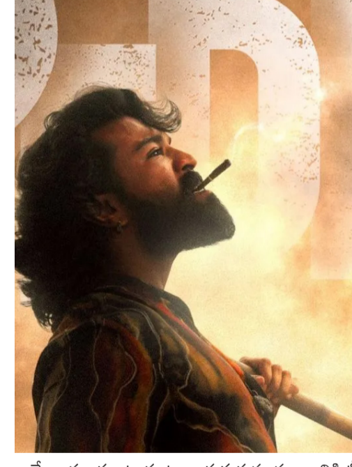
అయ్యే అవకాశం ఉండంటూ జరుగుతున్న ప్రచారానికి టీం ట్రైకులు వేసినట్లే!

ఆర్ఆర్ఆర్ (RRR) తర్వాత రామ్ చరణ్ తేజ హీరోగా నటిస్తున్న సినిమా 'పెద్ది'. 'ఉప్పెన' తర్వాత బుచ్చిబాబు డైరెక్ట్ చేస్తున్న ఈ సినిమా మీద భారీ అంచనాలు ఉన్నాయి. దానికి తగ్గట్టుగానే, సినిమా నుంచి రిలీజ్ అవుతున్న ప్రతి ప్రమాషనల్ స్టంప్ సినిమా మీద అంచనాలను మరింత రెడ్డింపు చేసేలా ఉంటున్నాయి. అయితే, ఈ సినిమా వాయిదా పడుతుందని ముందు నుంచి పెద్ద ఎత్తున ప్రచారం జరుగుతున్న సంగతి తెలిసిందే. ప్రస్తుతానికి ఈ సినిమా ఏప్రిల్ 30వ తేదీన రిలీజ్ అవుతుందని చివరిగా ప్రకటించారు. అయితే ఆ రోజు కూడా సినిమా రిలీజ్ అవ్వడం కష్టమేనా అనే ప్రచారం పెద్ద ఎత్తున జరుగుతోంది. తాజాగా టీం నుంచి అందుతున్న సమాచారం మేరకు, ఈ సినిమా వాయిదా పడడం లేదని అంటున్నారు. ఈ సినిమాకి సంబంధించి కొంత ప్యాప్ వర్క్ పాటు, స్పెషల్ సాంగ్ మాత్రమే పెండింగ్ ఉంది. ప్రస్తుతానికి రామ్ చరణ్ తేజ అయ్యప్ప స్వామి దీక్షలో ఉన్నారు. ఈ దీక్షలో ఉండగా స్పెషల్ సాంగ్ చేయలేరు కాబట్టి, ప్రస్తుతానికి ఆ సాంగ్ చేయడం లేదు. రామ్ చరణ్ అయ్యప్ప దీక్ష పూర్తయిన వెంటనే ఆ సాంగ్ మాట్ చేయబోతున్నారు. మరోవకట్టు బుచ్చిబాబు ప్యాప్ వర్క్ ఫినిష్ చేస్తున్నట్లు తెలుస్తోంది. ఇక ఈ సినిమాని ఏప్రిల్ 30వ తేదీన గ్రాండ్ స్పెషల్ రిలీజ్ చేసేందుకు ప్లాన్ చేస్తున్నారు. రామ్ చరణ్ పుట్టినరోజు సందర్భంగా యుఎస్ (US) బుకింగ్స్ కూడా అదే రోజు ఓపెన్ చేసే అవకాశం ఉంది. కాబట్టి 'పెద్ది' షోస్టోప్స్ ట్రైకులు వేసినట్లే!