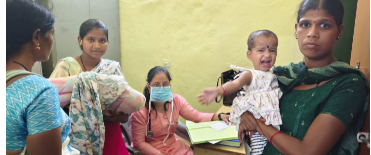
నిజామాబాద్ పోతంగల్ మార్చి 25 (డిడి9 వార్త):

నిజామాబాద్ జిల్లా పోతంగల్ మండలంలోని ప్రభుత్వ ఆసుపత్రి నందు ప్రజా పాలన ప్రణాళికలో భాగంగా పోతంగల్ మండల కేంద్రం లోని ప్రాథమిక ఆరోగ్య కేంద్రంలో బుధవారం వైద్య శిబిరం ఏర్పాటు చేశారు. నిజామాబాద్ జిల్లా ప్రభుత్వ మెడికల్ కాలేజీ తరఫున బుధవారం రోజు ఉచిత వైద్య శిబిరం నిర్వహించారు ఈ శిబిరానికి పోతంగల్