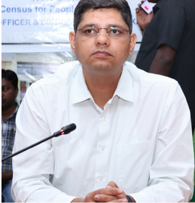
కామారెడ్డి, మర్చి 26 (డిడి9 వార్త):