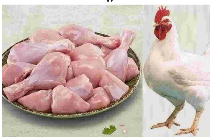
ధరలు మారుతుంటాయని వ్యాపారస్థులు తెలిపారు.

అరంభంలో కిలో చికెన్ ధర రూ. 360 రూ. 400 పలికింది. వేసవి ఉష్ణోగ్రతలు పెరగడంతో కోళ్లు చనిపోవడం, వాటి దాణా ఖర్చులు పెరగడంతో కోళ్ల ఫారమ్లు యజమానులు ధరలను పెంచారు. ఇదే సమయంలో పెళ్లిళ్లు, ఇతర శుభకార్యాలకు కూడా ఉండటంతో చికెన్ కు గిరాకీ ఏర్పడింది. వెరన్ సిస్టమ్ లెస్, నార్మల్ చికెన్ ధర కూడా ఆల్ టైమ్ రికార్డుకు చేరింది. గతవారం కేజీ చికెన్ ధర ఏకంగా రూ. 400 కు చేరడంతో.. చికెన్ ప్రియులంతా సీ ఫుడ్ వైపు మళ్లారు. వారంరోజుల తర్వాత కిలో చికెన్ రేటు ఏకంగా రూ. 100 వరకు తగ్గింది. హైదరాబాద్ లో నేడు సిస్టమ్ లెస్ చికెన్ కేజీ ధర రూ. 270 గా ఉండగా.. అటు వరంగల్ లోనూ అదే ధర కొనసాగుతోంది. ఆంధ్రప్రదేశ్ లోని అమలాపురంలో మాత్రం రూ. 300-350 పలుకుతోంది. ఉష్ణోగ్రతల్లో హెచ్చుతగ్గులు, కోళ్ల పెంపకం, లభ్యతను బట్టి