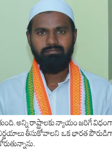
తుంది. అన్ని రాష్ట్రాలకు న్యాయం జరిగి విధంగా నిర్ణయాలు తీసుకోవాలని ఒక భారత పౌరుడిగా కోరుతున్నాను.

315 సీట్లు పోంది దేశ రాజకీయాలలో ఏకాధిపత్యం చలాయిస్తాయి. దీంతో దక్షిణాది రాష్ట్రాలకు తీవ్ర అన్యాయం జరుగుతుంది. అదేవిధంగా, రాజ్యసభలో ప్రతి రాష్ట్రానికి సమాన ప్రాతినిధ్యం కల్పించే విధంగా సీట్ల కేటాయింపును పునఃపరిశీలించడం అవసరం. అమెరికా తరహా రాజ్యసభ (సెనేట్) లో ప్రతి రాష్ట్రం నుండి జనాభా తో సంబంధం లేకుండా ఇద్దరు చొప్పున సభ్యులను ఎన్నుకోవడం జరుగుతుంది అలాగే రాజ్యసభకు జనాభాతో సంబంధం లేకుండా రాజ్యసభ సీట్లను ప్రతి రాష్ట్రానికి సమానంగా కేటాయించాలి. రాజ్యసభను నిజమైన ఫెడరల్ చాంబర్గా మార్చగలిగితే రాష్ట్రాల మధ్య సమానత్వం ప్రతిబింబించబడు