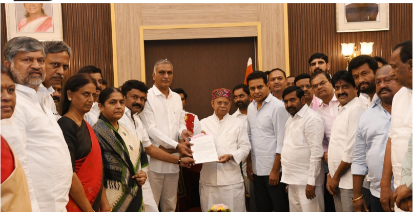
విచారణ చేయాలని సవాల్ విసిరారు. ప్రభుత్వం కంపెనీపై చర్యలు తీసుకొని తన చిత్తశుద్ధి నిరూపించుకోవాలని సూచించారు. రాష్ట్ర ప్రభుత్వ అవినీతి, పొంగులేటి అక్రమ మైనింగ్ భూకట్టల పైన త్వరలోనే కార్యచరణ ప్రకటిస్తా

సంఘాన్ని ఏర్పాటు చేయాలని లేదా ఒక ఇం డిపెండ్ జ్యూడిషియల్ ఎంక్వైరీ కావాలని కోరారు. ప్రభుత్వంలో కీలక మంత్రిగా ఉన్న పొంగులేటి తన ప్రభుత్వమే చేపట్టే విచారణను ప్రభావితం చేసే అవకాశం ఉన్నదని, ఆయన్ను బర్తరఫ్ చేసి విడుదల నుంచి తప్పించాలని డిమాండ్ చేశారు. గవర్నర్ ఈ అంశంలో జోక్యం చేసుకొని న్యాయం చేయాలని కోరారు. సుతంత్ర విచారణ లేదా మైక్రో స్టిటింగ్ జడ్జి లేదా కేంద్ర ప్రభుత్వ సంస్థలతో విచారణకు ఆదేశించే విధంగా చర్యలు తీసుకోవాలని విజ్ఞప్తి చేశారు. రాష్ట్ర ప్రభుత్వం ఎంక్వైరీ చేస్తే అమృత కుంభకోణం, ఫోన్ ట్యాపింగ్ కుంభకోణం, సింగిరేజీ కుంభకోణం, హైదరాబాద్ పారిశ్రామిక భూమిల హిల్స్ పాలీసీ కుంభకోణం, ఇలా దాదాపు 14 అంశాల పైన ఆధారాలు ఇవ్వడానికి సిద్ధంగా ఉన్నామని, వాటిపైనా