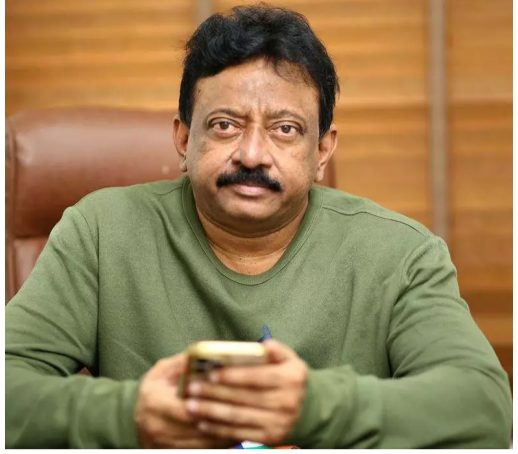
అని ఆర్డీవీ సలహా ఇచ్చారు. ప్రస్తుతం ఈ వ్యాఖ్యలు సోషల్ మీడియాలో వైరల్ గా మారాయి. రూ.1.365 కోట్లు సాధించిన 'ధురంధర్ 2'.. రజవీర్ సింగ్ హీరోగా తెరకెక్కిన ఈ చిత్రం తొలిరోజు నుంచే వసూళ్ల సూచన సృష్టిస్తోంది. ఇప్పటివరకూ ప్రపంచవ్యాప్తంగా రూ.1.365 కోట్లు తన ఖాతాలో వేసుకుంది. దీంతో మొదటి భాగం ఆల్ టైమ్ కలెక్షన్స్ (రూ.1.307 కోట్లు)ను ఈ సిక్వెల్ కేవలం 11 రోజుల్లోనే దాటింది.

దర్శకుడు రామ్ గోపాల్ వర్మ మరోసారి సోషల్ మీడియా వేదికగా సంచలన వ్యాఖ్యలు చేశారు. ఆదిత్య ధర్ తెరకెక్కించిన తాజా చిత్రం 'ధురంధర్ 2' బాక్సాఫీస్ వద్ద సృష్టిస్తోన్న ప్రభంజనంపై స్పందిస్తూ.. చిత్ర పరిశ్రమలోని ప్రముఖుల మౌనాన్ని ఆయన ప్రస్తావించారు. ఈ సినీమా సాధించిన విజయం ఒక 'అణుబాంబు' లాంటిదని ఆయన అన్నారు. "ఆదిత్య ధర్ చిత్ర పరిశ్రమకింద ఒక అణుబాంబును పేల్చారు. కానీ ఆశ్చర్యకరమైన విషయం ఏమిటంటే.. మిగిలిన చిత్ర పరిశ్రమ అంతా మౌనం పాటిస్తోంది. 'ధురంధర్ 2' పేలుడు ధాటికి అందరూ అంతరికర్ణంలోకి వెళ్ళారేమో.. అందుకే వారి చప్పుట్లు ఇక్కడికి వినిపించడం లేదు. బహుశా వారంతా ఇది కేవలం ప్రచారమే అని, త్వరలోనే తగ్గిపోతుందని తమతో తాము గుసగుసలాడుకుంటున్నారేమో. అలా అనుకుంటూ మళ్ళీ పాత కాలపు మూస సినిమాలను తీయాలని చూస్తున్నారు. లేదా ఈ సినీమా అమ్ముతమైన విజయాన్ని చూసి, తాము తీస్తున్న సినిమాలు దీని ముందు నిలవలేవని అనుకొని మౌనంగా ఉంటున్నారేమో" "కళ్ళెదుట దైవోసారీ లాంటి సినీమా నిలబడి నిర్మూల కురిపిస్తుంటే, దాని బాక్సాఫీస్ గర్వంతో భూమి కంపిస్తుంటే.. కళ్ళు మూసుకోవడం సరైన పద్ధతి కాదు. నా సహచరులందరికీ నేను ఇచ్చే సలహా ఒక్కటే.. 'ధురంధర్ 2' సినీమాను ఒక పాఠంలా చదవండి. దీన్ని చూసి మీ చిత్రాల్లో మార్పులు చేసుకోండి"