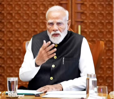
బోతోంది. ఒకవైపు అధికారాన్ని కొనసాగించాలనే ప్రయత్నం జరుగుతుండగా, మరోవైపు ప్రతిపక్షం తిరిగి అధికారంలోకి రావాలని కృషి చేస్తోంది. ఈ సేవార్థంలో రాజకీయ వాతావరణం రోజురోజుకూ వేడెక్కుతోంది. మొత్తానికి అసోం ఎన్నికలు శాంతి, అభివృద్ధి, భద్రత, వలసలు, యువత భవిష్యత్తు వంటి కీలక అంశాల మట్టా తిరుగుతున్నాయి. ప్రజలు ఏ నిర్ణయం తీసుకుంటారన్నది ఇప్పుడు ఆసక్తిగా మారింది. ఎన్నికల ఫలితాలు రాష్ట్ర భవిష్యత్తును నిర్ణయించేలా ఉండనున్నాయి.

కూడా ఎన్నికల్లో ప్రధాన చర్యగా మారింది. ఇక రాజకీయ ఆరోపణల వరంపరలో భాగంగా సాంప్రదాయాల విషయంలో కూడా విమర్శలు వెల్లువెత్తుతున్నాయి. రాష్ట్ర సంస్కృతిని గౌరవించలేదని ప్రతిపక్షంపై ఆరోపణలు వచ్చాయి. స్థానిక సంప్రదాయాలను పాటించడంలో నిర్లక్ష్యం చూపారని విమర్శించారు. ఈ అంశం కూడా ప్రజల్లో చర్చకు దారితీసింది. అభివృద్ధి ప్రాంతాల్లో, గత పదేళ్లలో అసోంలో మౌలిక వసతులు మెరుగుపడ్డాయని పేర్కొన్నారు. రహదారులు, వంతెనలు, విద్య, ఆరోగ్య రంగాల్లో పురోగతి సాధించినట్లు తెలిపారు. పెట్టుబడులు పెరిగిందని, పరిశ్రమలు స్థాపించబడుతున్నాయని చెప్పారు. యువతకు అవకాశాలు పెరుగుతున్నాయని, రాష్ట్రం అభివృద్ధి మార్గంలో ముందుకు సాగుతోందని వివరించారు.