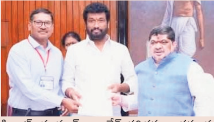
కిన్యార్డ్, మాహార్, నాందేడ్ తదితర అంతర్రాష్ట్ర బస్సు సర్వీస్ లు నడపటంతో ఆర్టీసీ అదాయం పెరుగుతుందని ఎమ్మెల్యే తెలిపారు. అదే

లకు ఆర్టీసీ సేవలు కనెక్టివిటీ చేయాలని తెలిపారు. బోధో నుంచి మహా పోచమ్మ నుంచి నిర్మల్, ఇటు మహారాష్ట్ర లోని శివుని, చికిలి, బైంసా,