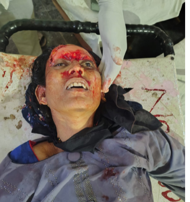
గా, ఆమె అప్పటికే మృతి చెందినట్లు నిర్ధారించారు. ఈ ఘటనపై కేసు నమోదు చేసి దర్యాప్తు కొనసాగిస్తున్నట్లు పోలీసులు తెలిపారు.