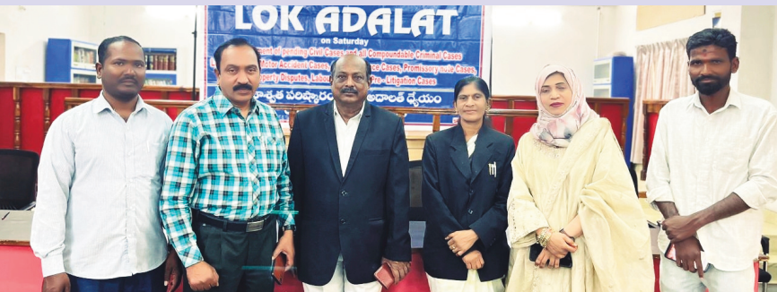
స్పెషల్ మొబైల్ జడ్జి బి. దీక్ష

జాతీయ లోక్ అదాలత్లో 50కి పైగా కేసుల పరిష్కారం