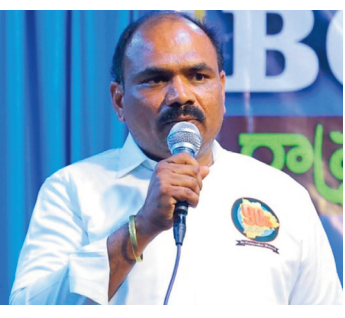
ప్రభుత్వం కేంద్ర ప్రభుత్వం నుండి వివక్షనగా అదిలాబాద్ అర్బూర్ రైల్వే లైన్ ఎయిర్పోర్టు మంజూరు చేయాలని డిమాండ్ చేశారు. ఎక్కడా లేనివిధంగా

వ్యక్తం చేశారు. శనివారమైన ఇచ్చోడలో విలే కరలుతో మాట్లాడుతూ ఇప్పటివరకు కనీసం రైలు సౌకర్యం లేదని విమానం వస్తుందని జిల్లా ప్రజా ప్రతినిధులు అధికార యంత్రాంగం ఎన్నో ఏళ్లుగా చెబుతున్న అవి వట్టి మాటలుగా రుజువయ్యాయని అన్నారు. గత బి ఆర్ ఎస్ నేటి బీజేపీ కాంగ్రెస్ సీఎంల మంత్రులు ఎంపీలు వాళ్ల వాళ్ల జిల్లాలను మాత్రమే అభివృద్ధి చేయించుకున్నారు తప్ప విద్యా వైద్యం ఉపాధి రంగాలలో పూర్తిగా వెనుకబడిన అదిలాబాదును మాత్రం వట్టి చుక్కోలేదని వాపోయారు. తక్షణమే రాష్ట్ర