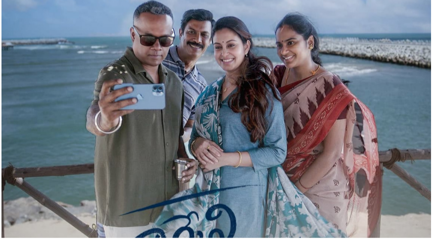
తమ నటనతో మంచి ప్రశంసలు అందుకుంటున్నా రు. ఓవరాలిగా చూస్తే, 'కార్నేని సెల్వం' సినిమా మిడిల్ క్లాస్ ఫ్యామిలీ ఆడియన్స్ ను ఆకట్టుకునే అవకాశాలు కనిపిస్తున్నాయి.