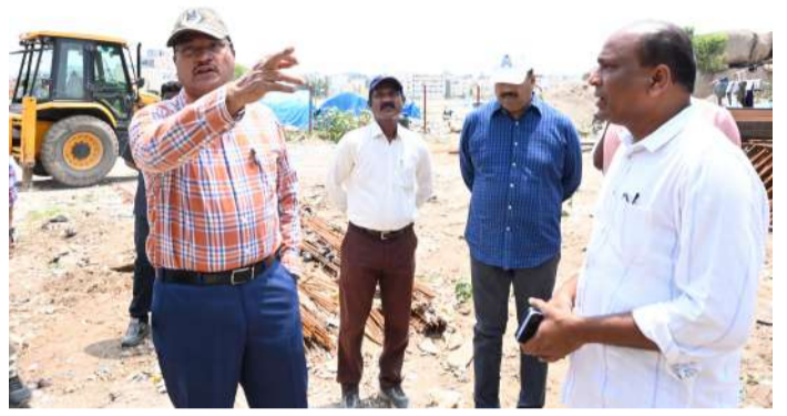
వరద కాలువ సమస్యను పరిష్కరిస్తాం..

ఆక్రమణదారుల పత్రాలను పరిశీలించి చర్యలు తీసుకోవాలని సూచించారు. సున్నం చెరువు చెంత సర్వే నంబరు 30, 31కి సంబంధించిన పూర్తి వివరాలు తెలుసుకుని.. ప్రభుత్వ భూమి ఉంటే అంగుళం కూడా పోకుండా సెక్యూర్ చేయాలన్నారు. ఈ రెండు సర్వే నంబర్ల మధ్య ఉన్న ప్రభుత్వ భూమికి సంబంధించిన వివరాలను అడిగి తెలుసుకోవడమే కాకుండా.. క్షేత్ర స్థాయిలో పరిశీలించారు. తమ్మిడికుంట చెరువుకు పై భాగంలో కింది భాగంలో ఉన్న ప్రభుత్వ భూములను తమదిగా క్వేమ్ చేస్తున్న వారి పత్రాలను పరిశీలించాలన్నీరు. తమ్మిడికుంట చెరువును ఎంతో సుందరంగా తీర్చిదిద్దుతుంటే.. పై భాగంలో వేస్తున్న చెత్త, వ్యర్థాల వల్ల మళ్లీ నీరు కలుషితమయ్యే ప్రమాదముందని హెచ్చరించారు.