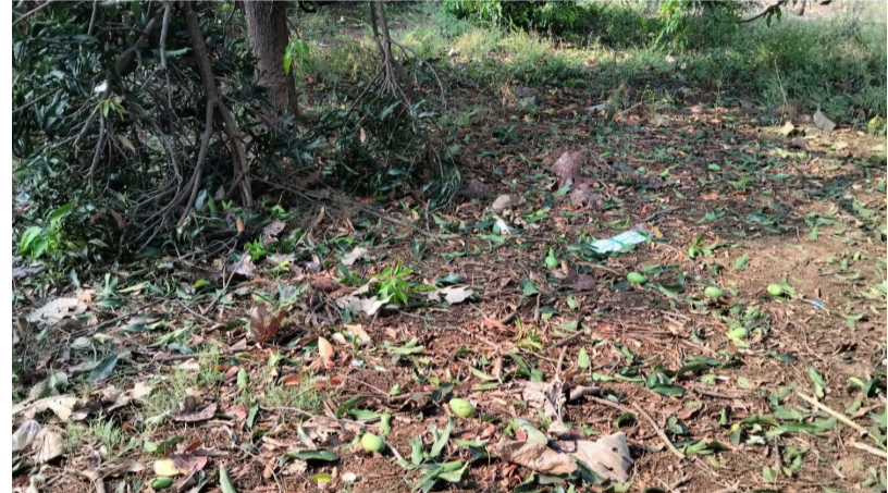
19 వర్షానికి నెల రాలిన హైదరాబాద్ కాయలు

మందర్మ గ్రామాల్లో గాలివాన బీభత్సం సృష్టించడంతో వేలాది ఎకరాల్లో పంటలు దెబ్బతిన్నాయి. పంట చేతికొచ్చి, కోతలు కోస్తా మనుకుంటున్న తరుణంలో ఈ విపత్తు సంభవించడంతో రైతులు కోలుకోలేని విధంగా నష్టపోయారు. పొలాల్లో నిలబడ్డ పంటలే కాకుండా, కోతలు పూర్తి చేసి కల్లాల వద్ద ఆరబెట్టిన ధాన్యం సైతం అకాల వర్షానికి తడిసి ముద్దయింది. ఎండబెట్టిన ధాన్యపు రాశులపై టార్పాలిన్లు కప్పే లోపే వడగండ్లతో కూడిన వర్షం ముంచెత్తడంతో వద్దు తడిసిపోయాయి. మొక్కజొన్న కంకులు కూడా వర్షపు నీటిలో నానిపోవడంతో నాణ్యత దెబ్బతిని, మొలకెత్తే