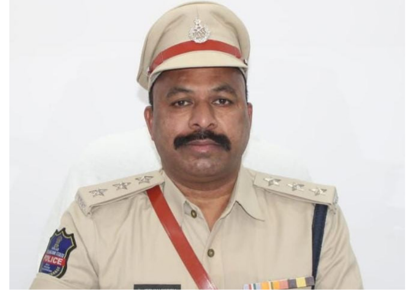
చట్ట ప్రకారం చర్యలు తప్పవని తెలియజేశారు. చట్టాన్ని చేతిలోకి తీసుకునే ప్రయత్నం చేయవద్దని, శాంతిభద్రతల సమస్యలు తరలెత్తే ప్రవర్తనలను వారిపై చర్యలు తప్పవని హెచ్చరించారు.