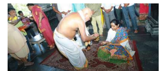
జనగామ ఏప్రిల్ 7 (డిడి 9 వార్త) బ్యూరో

వేయి స్తంభాల ఆలయ అభివృద్ధికి కేంద్ర ప్రభుత్వం రూ. 14.44 కోట్లు మంజూరు చేసిన నేపథ్యంలో వరంగల్ ఎంపీ డా. కడియం కావ్య ఆలయాన్ని సందర్శించి పనులపై సమీక్ష నిర్వహించారు. ఎమ్మెల్యే నాయిని రాజేందర్ రెడ్డితో కలిసి ఆలయానికి చేరుకున్న ఆమెకు