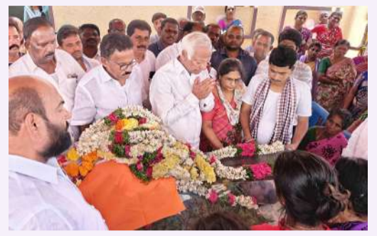
జనగామ ఏప్రిల్ 7 (డిడి 9 వార్త) బ్యూరో