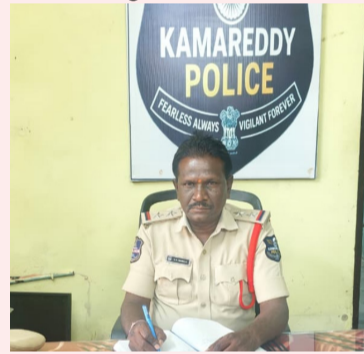
చర్యలు తీసుకుంటామని తెలిపారు. ప్రజలు పోలీసులకు సహకరించాలని కోరారు.