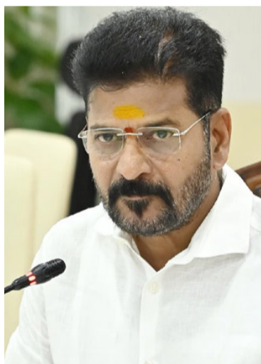
న్యాయని గుర్తుచేశారు. ఈ నేపథ్యంలో ఆ రాష్ట్రాల ప్రయోజనాలను కాపాడటం ముఖ్యమని అన్నారు.

వెనుక నిజాయితీ లేదని ఆరోపించారు. బిల్లును మూడు వేర్వేరు ప్రతిపాదనల రూపంలో తీసుకువచ్చి, అసలు ఉద్దేశం డీలీమిటేషన్ అమలు చేయడమేనని పేర్కొన్నారు. ఈ చర్యల ద్వారా రాజ్యాంగ నిర్మాణంలో మార్పులు తీసుకురావాలన్న ప్రయత్నం జరిగిందని వ్యాఖ్యానించారు. దిల్లీలో మీడియాతో మాట్లాడిన సీఎం, విపక్షాల ఐక్యత వల్లే ఈ బిల్లు ముందుకు సాగలేదని తెలిపారు. ఇది సాధారణ రాజకీయ ఓటమి కాదని, కేంద్ర ప్రభుత్వ విధానాలపై వచ్చిన ప్రతిఘటన అని పేర్కొన్నారు. మహిళా రిజిస్ట్రేషన్ పేరుతో దక్షిణాది రాష్ట్రాల ప్రాతినిధ్యాన్ని తగ్గించే ప్రయత్నం జరిగిందని ఆరోపించారు. ఈ నేపథ్యంలో లోకసభ వేదికగా ఆ ప్రయత్నాన్ని అడ్డుకున్నామని స్పష్టం చేశారు.