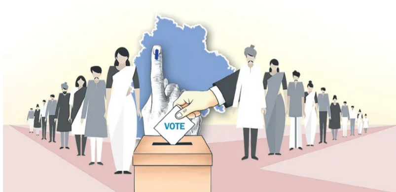
జిల్లా పరిషత్ల జాబితాలో మార్పులు చోటు చేసుకున్నాయి. ప్రస్తుతం రాష్ట్రంలో మొత్తం 31 జిల్లా పరిషత్లు ఉన్నాయి.

చేయనున్నారు. ఈ ముసాయిదా జాబితాలపై ప్రజల నుంచి అభ్యంతరాలు, సూచనలు స్వీకరించి తుది జాబితాను రూపొందిస్తారు. ఈ ప్రక్రియ పూర్తయిన తర్వాత పోలింగ్ కేంద్రాల ఏర్పాట్లు, బ్యాలెట్ బాక్కులు, సిబ్బంది నియామకం వంటి తదుపరి చర్యలు చేపడతారు. గతంలోనే ఎన్నికల ప్రక్రియ ప్రారంభమైందా? అనే అంశంపై అధికార ప్రతినిధులను అనుకున్నారు. వారి పదవీకాలం గత ఏడాది జూన్ తో ముగియడంతో అప్పటి నుంచి ప్రత్యేక అధికారుల ఆధ్వర్యంలో పాలన కొనసాగుతోంది.