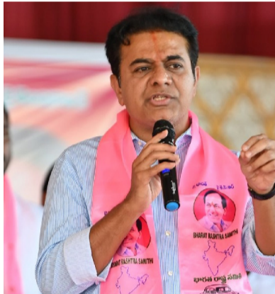
మామూలు నెలల్లో పుట్టకపోవచ్చు.. మరి 30 నెలలు గడిచినా ఒక్క హామీ అమలు కాకపోతే నిన్ను ఏమనాలి?" అని నిలదీశారు. కాంగ్రెస్ మాటలు ఆకాశంలో ఉన్నాయని, కానీ క్షేత్రస్థాయిలో పని మాత్రం సన్నా అని విమర్శించారు. నల్గొండ జిల్లాకు చెందిన మంత్రి ఉత్తమ్ కుమార్ రెడ్డిపై కూడా కేటీఆర్ విరుచుకుపడ్డారు. ఆరడు గుల ఎత్తు ఉన్న ఉత్తమ్ వల్ల జిల్లాకు జరిగిన లాభం ఏమీ లేదని, కృష్ణా నీళ్లు తాగి పెగగడం తప్ప రైతుల కోసం ఆయన చేసేదేమీ లేదని ఎద్దేవా చేశారు. కాంగ్రెస్ కు ఓటు వేసి తప్పనేమీ చేశామని ఇప్పుడు నల్గొండ జిల్లా రైతుల స్వయంగా చెబుతున్నారని కేటీఆర్ వ్యాఖ్యానించారు.

కేటీఆర్ ఎద్దేవా చేశారు. ఇటీవల శంషాబాద్ సమీపంలో తాము గతంలో తీసుకువచ్చిన ఒక కంపెనీ ప్రారంభోత్సవానికి రేవంత్ రెడ్డి వెళ్లారని, అక్కడ పిలిచే యాంకర్ కూడా ఆయనను గుర్తుపట్టలేకపోయిందని విమర్శించారు. ముఖ్యమంత్రి పేరు చెప్పడానికి బదులు మంత్రి శ్రీధర్ బాబు పేరును యాంకర్ ఉచ్చరించడాన్ని ప్రస్తావిస్తూ.. 'రేవంత్ రెడ్డి కేవలం తాము కట్టిన ప్రాజెక్టులకు రివ్యూ కలిగి చేయడం తప్ప కొత్తగా చేసేదేమీ లేదని మరల మరల మరల అంటుంటున్నారు. ఎన్నికల సమయంలో కాంగ్రెస్ నేతలు ఇచ్చిన హామీలను కేటీఆర్ ఈ సందర్భంగా గుర్తు చేశారు. "100 రోజుల్లోనే ఆరు గ్యారంటీలను అమలు చేస్తామని జెమ్మే బాండ్ తరహాలో బాండ్ పేపర్లు రాసి ఇచ్చారు. గ్యారంటీ కార్డులను భద్రంగా దాచుకోమని భట్టి విక్రమార్కు ప్రజలకు చెప్పారు. కానీ ఇప్పుడు 1000 రోజులు కావస్తున్నా ఆ కార్డులు ఎక్కడ పెట్టుకోవాలి? చెప్పాలి" అని ప్రశ్నించారు. రైతు, మహిళా, యువజన డిక్ష రెషన్ పేరుతో కాంగ్రెస్ 420 అడ్డమైన హామీలు ఇచ్చి ప్రజలను వంచించిందని ఆరోపించారు. హామీల అమలు గురించి అడిగితే రేవంత్ రెడ్డి వింత సమాధానాలు ఇస్తున్నారని ఉద్ఘాటించి మండిపడ్డారు. "మామూలు నెలల్లో పిల్లలు కుడితారా? అని ముఖ్యమంత్రి మాట్లాడుతున్నారు. సరే,