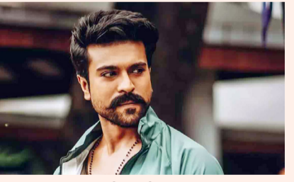
సుకుమార్ తనదైన శైలిలో మరో శక్తిమంతమైన మూన్ యాక్షన్ కథను సిద్ధం చేస్తున్నట్లు తెలుస్తోంది.