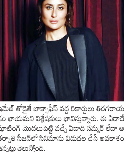
ఇమేజ్ తోడైతే బాకాఫీన్ వద్ద రికార్డులు తిరగరాయ ఈ భూమిని విశ్లేషకులు భావిస్తున్నారు. ఈ ఏడాదే హాలీవుడ్ మొదలపెట్టి వచ్చే ఏడాది సమ్మర్ లేదా ఆ తర్వాతి సీజన్ లో సినిమాను విడుదల చేసే అవకాశం ఉన్నట్లు తెలుస్తోంది.