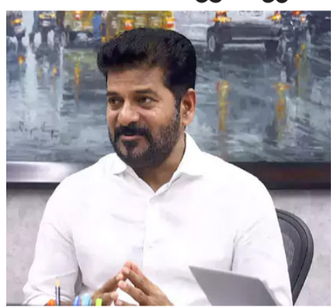
శ్రయ పరిసర ప్రాంతాల్లో ఇటీవల చోటుచేసుకున్న ట్రాఫిక్ అంతరాయం నేపథ్యంలో ముఖ్యమంత్రి రేవంత్ రెడ్డి తీవ్ర ఆగ్రహం వ్యక్తం చేశారు. తన పర్యటనల కారణంగా ప్రజలను గంటల తరబడి రోడ్లపై ..మిగతా 2లో

నా కాన్వాయి కోసం ప్రజలను ఆపుతారా? డీజిపీకి సీఎం రేవంత్ రెడ్డి కీలకమైన ఆదేశాలు ప్రజలకు ఇబ్బందులు కలిగితే కఠిన చర్యలు ట్రాఫిక్ నియంత్రణలో మార్పులు అవసరం ఎయిర్ పోర్టు పరిసరాల్లో అప్రమత్తత పెంచాలి సింగిల్ లైన్ విధానంపై దృష్టి పెట్టాలని సూచన ప్రత్యామ్నాయ మార్గాల నిర్దేశంపై ఆదేశాలు పోలీసు అధికారులకు డీజిపీ మార్గదర్శకాలు ట్రాఫిక్ సమస్యలపై ముఖ్యమంత్రి ఆగ్రహం అడిషనల్ డీజిపీ ఆధ్వర్యంలో ట్రాఫిక్ బ్యూరో విధుల్లో నిర్ణయానికి తావు ఇవ్వాలని కఠిన ఆదేశాలు ప్రజల ప్రయాణాలకు అంతరాయం వద్దన్న సీఎం హైదరాబాద్, (డిడి9 వార్త):