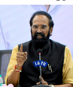
తన హయాంలోనే రాష్ట్రంలో రికార్డ్ స్థాయిలో ధాన్యం దిగుబడి వచ్చిందని వెల్లడించారు. ధాన్యం కొనుగోలు, దిగుబడిలో బీఆర్ఎస్ అసత్య ప్రచారానికి పాల్పడుతున్నదని, శాసన సభ, లోక్ సభ, సర్పంచ్, మున్సిపల్ ఎన్నికల్లో ప్రజలు గుణపాఠం చెప్పినా ఆ పార్టీ నేతలకు కనువిప్పు కలుగ లేదన్నారు. దేశం మొత్తం లోనే రికార్డ్ స్థాయిలో దిగుబడి, కొనుగోలు జరిపింది ..మిగతా 2లో

ధాన్యం కొనుగోళ్లపై అసహనం రాధాంతం చేస్తున్నాయి రాష్ట్రంలో రికార్డ్ స్థాయిలో దిగుబడి కొనుగోలుపై బీఆర్ఎస్ అసత్య ప్రచారం తగదు వరుస ఎన్నికల్లో గుణపాఠం చెప్పినా కనువిప్పు కలుగలేదా? మంత్రి ఉత్తమ కుమార్ రెడ్డి కౌంటర్ హైదరాబాద్, (డిడి9 వార్త):