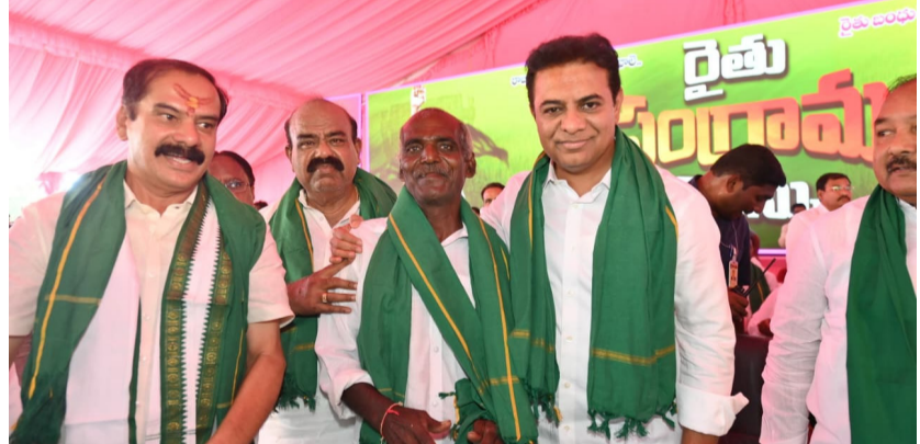
వరంగల్ వేదికగా బీఆర్ఎస్ ఆధ్వర్యంలో జరిగిన రైతు సంగ్రామ సదస్సు రాజకీయ వేడిని మరింత పెంచింది. ఈ కార్యక్రమంలో బీఆర్ఎస్ కార్యనిర్వహక అధ్యక్షుడు కేటీఆర్ పాల్గొని రాష్ట్ర ప్రభుత్వంతో పాటు కాంగ్రెస్ పై తీవ్రస్థాయిలో విమర్శలు చేశారు. రైతు సమస్యలు, హోమీలు అమలు, సంక్షేమ పథకాలపై ఆయన చేసిన వ్యాఖ్యలు రాజకీయ పర్జాల్లో చర్చనీయాంశంగా మారాయి. సదస్సులో మాట్లాడిన కేటీఆర్, రైతు డిక్లరేషన్ పేరుతో కాంగ్రెస్ పార్టీ ప్రజలను మోసం చేసిందని ఆరోపించారు. ఎన్నికల సమయంలో రైతులకు 34 హోమీలు ఇచ్చినప్పటికీ, అధికారంలోకి వచ్చిన తర్వాత వాటిలో ఒక్కటి అమలు చేయలేదని ఆయన విమర్శించారు. రైతుల నమ్మకాన్ని దెబ్బతీసే విధంగా కాంగ్రెస్ వ్యవహరించిందని ఆయన వ్యాఖ్యానించారు. కాంగ్రెస్ పార్టీ గత ఆరు దశాబ్దాల పాలనలో రైతుల సమస్యలను పట్టించుకోలేదని కేటీఆర్ ఆరోపించారు. రైతుల రక్తం తాగిన ..మిగతా 2లో

బీఆర్ఎస్ వర్కింగ్ ప్లెనీ కేటీఆర్ వరంగల్ లో బీఆర్ఎస్ ఆధ్వర్యంలో రైతు సంగ్రామ సదస్సు నిర్వహణ సదస్సులో పాల్గొని కాంగ్రెస్ పై తీవ్ర స్థాయిలో విరుచుకుపడ్డ కేటీఆర్ రైతు డిక్లరేషన్ పేరిటో నయవంచనకు పాల్పడిందని ఆరోపణ కాంగ్రెస్ 34 హోమీలు ఇచ్చి పవీ అమలు చేయలేదని వ్యాఖ్య 60 ఏళ్ల పాలనలో రైతులకు నష్టం జరిగిందని ఘాటు విమర్శ రైతు మేళా కాదు దగా మేళా అని కేటీఆర్ వ్యాఖ్య రైతు బంధు పేరును మార్చే ప్రయత్నాలు జరుగుతున్నాయని ఆరోపణ రైతు డబ్బులు రాజకీయ ప్రయోజనాలకు మళ్లించారని వ్యాఖ్య ముఖ్యమంత్రి పదవిపై కూడా తీవ్ర విమర్శలు చేసిన కేటీఆర్ కాంగ్రెస్ పాలనపై రాజకీయంగా ఎదురుదాడి పెంచిన బీఆర్ఎస్ హైదరాబాద్, (డిడి9 వార్త):