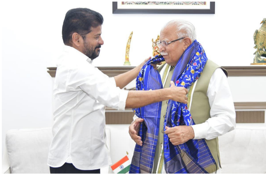
హైదరాబాద్, (డిడి9 వార్త): కను వెంటనే ఆమోదించాలని సీఎం కేంద్ర మంత్రికి సూచించారు. అనుమతుల అలస్యం లేకుండా ప్రక్రియను ముందుకు తీసుకెళ్లాలని కోరారు. కేంద్ర పట్టణాభివృద్ధి శాఖతో కీలక భేటీ కేంద్ర పట్టణాభివృద్ధి శాఖ మంత్రి మనోహర్ లాల్ ఖట్టర్ తో సీఎం రేవంత్ రెడ్డి దాదాపు ..మిగతా 2లో

కేంద్రానికి సీఎం రేవంత్ రెడ్డి విజ్ఞప్తి కేంద్ర మంత్రి ఖట్టర్ తో కీలక సమావేశం హైదరాబాద్ మెట్రో రెండో దశకు వేగం డీపీఆర్ ఆమోదం తక్షణం కావాలని విజ్ఞప్తి కేంద్ర పట్టణాభివృద్ధి శాఖతో సీఎం భేటీ నగర ట్రాఫిక్ సమస్యలపై ప్రధాన చర్చ మెట్రోను రాష్ట్ర ఆధీనంలోకి తీసుకున్న అంశం ప్రస్తావన శంషాబాద్-పూర్వ చీఫ్ కారిడార్ ప్రతిపాదన మెట్రో విస్తరణతో ఆర్థిక అభివృద్ధి ఆశలు మౌలిక సదుపాయాల ప్రాజెక్టులపై కేంద్ర సహకారం వేగవంతమైన అనుమతుల కోసం సీఎం ఒత్తిడి సానుకూల వాతావరణంలో ముగిసిన భేటీ