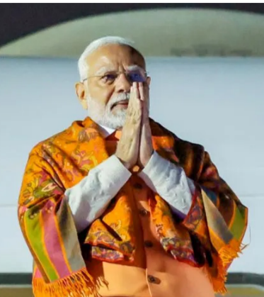
నాశ్రయానికి చేరుకుని అక్కడి నుంచి గుజరాత్ లోని జామ్ నగర్ కు పయనమవుతారు.

హైదరాబాద్, (డిడి9 వార్త): ప్రధాని నరేంద్ర మోదీ ఈ నెల 10న హైదరాబాద్ లో పర్యటించనున్నారు. ఈ పర్యటనకు సంబంధించిన పూర్తి షెడ్యూల్ ఖరారునట్లు అధికార పక్షం వెల్లడించాయి. అభివృద్ధి కార్యక్రమాలు, ప్రజాసభతో కూడిన ఈ పర్యటనకు నగరంలో విస్తృత ఏర్పాట్లు చేపడుతున్నారు. అధికారిక షెడ్యూల్ ప్రకారం ప్రధాని మోదీ ఆ రోజు మధ్యాహ్నం 2.50 గంటలకు బెంగళూరు నుంచి ప్రత్యేక విమానంలో బేగంపేట విమానాశ్రయానికి చేరుకోనున్నారు. అక్కడి నుంచి నేరుగా హెచ్ఎస్సీకి వెళ్లనున్నారు. హెచ్ఎస్సీలో పలు అభివృద్ధి ప్రాజెక్టులకు శంకుస్థాపనలు, ప్రారంభోత్సవాలు నిర్వహించనున్నారు. అనంతరం హైటెక్ సిటీలో ఏర్పాటు చేసిన ఓ ఆస్పత్రిని ప్రధాని ప్రారంభించనున్నారు. వైద్య రంగానికి సంబంధించిన కీలక కార్యక్రమంలో కూడా ఆయన పాల్గొననున్నట్లు సమాచారం. సాయంత్రం 6.30 గంటల నుంచి 7.30 గంటల వరకు సికింద్రాబాద్ లోని పరేడ్ గ్రౌండ్స్ లో నిర్వహించనున్న బహిరంగ సభలో ప్రధాని మోదీ పాల్గొని ప్రజలను ఉద్దేశించి ప్రసంగించనున్నారు. ఈ సభకు భారీ సంఖ్యలో ప్రజలు హాజరయ్యే అవకాశం ఉండటంతో భద్రతా ఏర్పాట్లను కట్టుదిట్టం చేస్తున్నారు. సభ అనంతరం ప్రధాని మోదీ బేగంపేట విమానాశ్రయానికి చేరుకుని అక్కడి నుంచి గుజరాత్ లోని జామ్ నగర్ కు పయనమవుతారు.