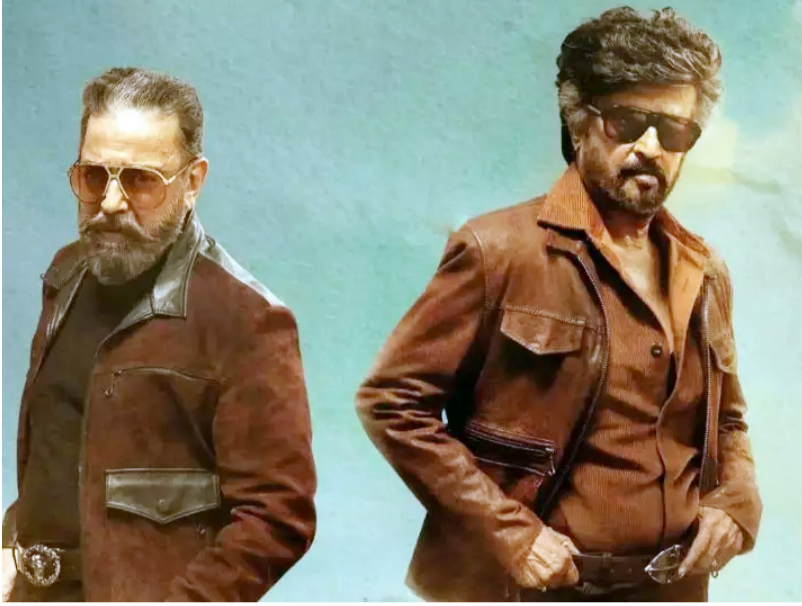
కుమార్ ఈ చిత్రానికి రూ.70 కోట్ల వరకు పారితోషకం తీసుకోబోతున్నట్లు టాక్ వినిపిస్తోంది. ఇలా ప్రధానంగా ఈ ముగ్గురి పారితోషకాలకే భారీ మొత్తంలో ఖర్చు అవుతుండగా,

సూపర్ స్టార్ రజనీకాంత్ లోకనాయకుడు కమల్ హాసన్ కాంట్రీనేషన్ లో ఓ సినిమా రూపొందించుకున్న విషయం తెలిసిందే. ఇప్పటికే ఈ చిత్రానికి సంబంధించిన అనౌన్స్ మెంట్ ను KHxRK అనే వర్సింగ్ బ్లెటిల్ తో విడుదల చేశారు. నెల్సన్ దిలీప్ కుమార్ ఈ క్రేజీ ప్రాజెక్ట్ కు దర్శకత్వం వహించనున్నారు. తాజాగా ఈ సినిమాకు సంబంధించిన బడ్జెట్ పై ఓ వార్త సోషల్ మీడియాలో వైరల్ గా మారింది. దాని ప్రకారం ఈ చిత్రాన్ని ఏకంగా రూ.600 నుంచి రూ.700 కోట్ల భారీ వ్యయంతో నిర్మించనున్నట్లు సమాచారం. ఈ సినిమా కోసం కమల్ హాసన్ రూ.200 నుంచి రూ.220 కోట్ల వరకు పారితోషకం తీసుకోనున్నట్లు, అలాగే లాభాల్లో కూడా వాటా పొందనున్నట్లు తెలుస్తోంది. ఇక రజనీకాంత్ ఈ మూవీ కోసం రూ.180 నుంచి రూ.200 కోట్ల వరకు రెమ్యూనరేషన్ అందుకోనున్నట్లు సమాచారం. అలాగే దర్శకుడు నెల్సన్ దిలీప్