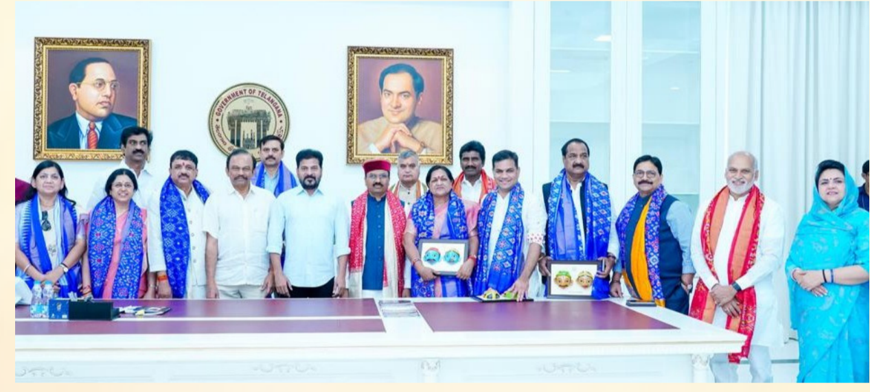
హైదరాబాద్, తెలంగాణ రాష్ట్ర రాజధాని హైదరాబాద్ నగరాన్ని ప్రపంచ స్థాయి ప్రమాణాలతో తీర్చిదిద్దడమే లక్ష్యంగా ప్రభుత్వం ఆడుగులు వేస్తోంది. పార్లమెంటరీ స్టాండింగ్ కమిటీ సమావేశంలో పాల్గొన్న ముఖ్యమంత్రి రేవంత్ రెడ్డి, రాష్ట్ర అభివృద్ధికి సంబంధించిన కీలక విజన్‌ను ఆవిష్కరించారు. ఆధునికీకరణ మరియు పట్టణీకరణ వల్ల భవిష్యత్తులో ఎదురయ్యే సవాళ్లను ఎదుర్కోవడానికి ఇప్పటి నుంచే ప్రణాళికాబద్ధంగా ముందుకు సాగాలని ఆయన పిలుపునిచ్చారు. పెరుగుతున్న పట్టణ జనాభాకు అనుగుణంగా మౌలిక సదుపాయాలను మెరుగుపరచడం అత్యవసరమని, ఈ క్రమంలోనే 'తెలంగాణ రైజింగ్ 2047' పేరుతో ఒక బృహత్తర..మిగతా 2లో

'తెలంగాణ రైజింగ్-2047' మాస్టర్ ప్లాన్ పాల్గొంటున్న స్టాండింగ్ కమిటీలో సీఎం రేవంత్ వివరణ నగరాన్ని సిగ్నల్ రహితంగా మార్చేందుకు ప్రణాళికలు అండర్ పాస్, సర్వేస్, ఎలివేటెడ్ పద్ధతులతో మార్పులు రాష్ట్రాన్ని క్యూర్, ప్యూర్, రేర్ అనే మూడు రకాలుగా వర్గీకరణ. సర్వీస్, మాన్యుఫ్యాక్చరింగ్, అగ్రికల్చర్ సెక్టార్లకు గుర్తింపు కేవలం రోడ్ల విస్తరణే కాకుండా బహుళ రవాణా వ్యవస్థల బలోపేతం కాలుష్య నియంత్రణలో భాగంగా ఈవీ బస్సులు ఉచిత రైల్వే ఫిట్టింగ్ ఆటోల పంపిణీ రాష్ట్ర సంస్కృతిలో మూసీ లివర్ ఫ్రంట్ అభివృద్ధి అనుసంధానం పట్టణీకరణకు అనుగుణంగా మౌలిక వసతుల కల్పనకు ప్రాధాన్యం