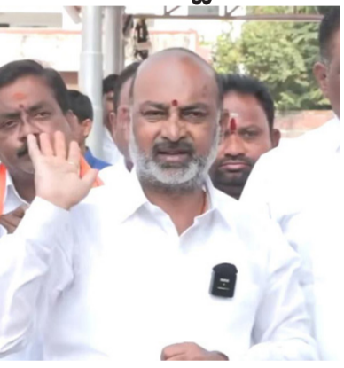
మారాయి. పార్టీ కోసం పూర్తిస్థాయి అంకిత భావంతో పనిచేసే కార్యకర్తను అడిగితే, తన చివరి కోరిక కూడా "మరణానంతరం బీజేపీ జెండా కప్పుకోవాలి" ..మిగతా 2లో

కేంద్ర మంత్రి బండి సంజయ్ వ్యాఖ్యలు తెలంగాణలో కుటుంబాలన అంతం చేశాను అందుకే కొందరు నా మీద పగబట్టినట్లు వ్యవహరిస్తున్నారు "చనిపోయిన తర్వాత కూడా పార్టీ జెండా కప్పుకుంటాను అవినీతి సామ్రాజ్యాన్ని కూల్చినది బీజేపీనే అని వ్యాఖ్య హైదరాబాద్ లో మీడియాతో సంజయ్ కీలక వ్యాఖ్యలు హైదరాబాద్, (డిడి9 వార్త): బీజేపీ కార్యకర్తల క్రమశిక్షణ, నిబద్ధతపై కేంద్ర మంత్రి బండి సంజయ్ చేసిన వ్యాఖ్యలు రాజకీయ వర్గాల్లో చర్చనీయాంశంగా