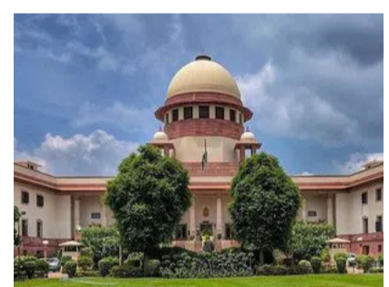
హైదరాబాద్, (డిడి9 వార్త): జనగణనలో కుల గణనను మినహాయించేలా కేంద్రానికి ఆదేశాలు ఇవ్వాలని కోరుతూ దాఖలైన ప్రజాప్రయోజన వ్యాజ్యం (పిల్)ను సుప్రీంకోర్టు కొట్టివేసింది. కుల ఆధారిత జనగణన సమాచారాన్ని సేకరిస్తే ఏజెన్సీలు దానిని దుర్వినియోగం చేసే అవకాశం ఉందని పేర్కొంటూ దాఖలైన ఈ పిటిషన్ పై ప్రధాన న్యాయమూర్తి జస్టిస్ సూర్యకాంత్ నేతృత్వంలోని ధర్మాసనం ..మిగతా 2లో

స్పష్టం చేసిన సుప్రీంకోర్టు అది విధానపరమైన అంశమని స్పష్టం చేసిన సుప్రీంకోర్టు వెనుకబడిన తరగతుల జనాభా తెలుసుకోవడం అవసరమని అభిప్రాయం జనగణనతోపాటు కులగణన చేయొద్దంటూ పిల్ డేటా దుర్వినియోగం వాదనను పిటిషనర్ తరపు వినిపించిన వాదన న్యాయస్థానాలు విధాన నిర్ణయాల్లో జోక్యం చేసుకోలేవని వ్యాఖ్య కేంద్ర ప్రభుత్వ పరిధిలోని అంశమని ధర్మాసనం స్పష్టం పిల్ లో జోక్యం చేసుకోవడానికి కారణం కనిపించలేదని తీర్పు కుల గణన అంశంపై మరోసారి చర్చకు తెరలేపిన తీర్పు