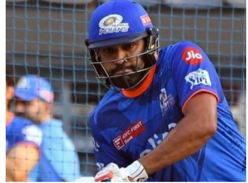
ప్రత్యామ్నాయ ఓపెనర్ల వేట రోహిత్ శర్మ భవిష్యత్తుపై సుప్రత లేకపోవడంతో సెలెక్టర్లు ప్రత్యామ్నాయాలపై దృష్టి పెట్టినట్లు సమాచారం. యశ్విన్ జైస్వాల్, శుభామన్ గిల్తో పాటు మరో బ్యాటర్స్ ఓపెనర్ ను సిద్ధం చేయాలని చూస్తున్నట్లు తెలుస్తోంది.

కోహ్లాతో పోలిక వధు విరాట్ కోహ్లా, రోహిత్ శర్మలను ఇకపై ఒకేలా చూడలేమని బీసీసీఐ వర్గాలు అంటున్నట్లు సమాచారం. ప్రస్తుతం కోహ్లా ఫిట్ నెస్, పామ్ మిగతా క్రికెటర్ల కంటే చాలా మెరుగ్గా ఉన్నాయని సమాచారం. మరోవైపు రోహిత్ శర్మ గతంలోలా దూకుడుగా ఆడకపోవడంపై కూడా టీమ్ మేనేజ్ మెంట్ అసంతృప్తితో ఉన్నట్లు ప్రచారం జరుగుతోంది. అందుకే రోహిత్ విషయంలో బీసీసీఐ మెడికల్ టీమ్ తో చర్చించి ఒక గట్టి నిర్ణయం తీసుకునే అవకాశం ఉందని చర్చ నడుస్తోంది.