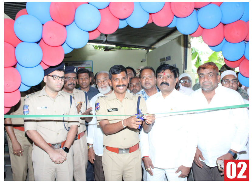
ఒక్క కెమెరా వంద మంది పోలీసులతో సమానం

తాను కష్టాలలో ఉన్నప్పుడు కూడా నమ్మగలిగే వారు నాకు ఆదర్శం తాను ఆపదలో ఉన్నప్పుడు కూడా ఇతరులకు సహాయం చేయగలిగే వారు నాకు స్ఫూర్తి