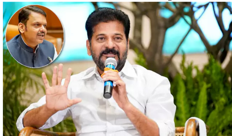
తెలంగాణలోని బీడు భూములకు సులభంగా నీటిని తరలించే విలుంటుందని సీఎం రేవంత్ ప్రత్యేకంగా ప్రస్తావించారు.

పూర్తిగా తీర్చడం సాధ్యం కాదని రేవంత్ సర్కార్ ఒక అంచనాకు వచ్చింది. ఆదిలాబాద్, నిజామాబాద్, కరీంనగర్, మెదక్ జిల్లాల పరిధిలోని లక్షలాది ఎకరాల సాగునీటి అవసరాలను, ప్రజల తాగునీటి గోసను తీర్చాలంటే తుమ్మిడిపాట్ల బ్యాండ్ ఎత్తుపై మహారాష్ట్రతో మరోసారి చర్యలు జరపడం అనివార్యమని సీఎం రేవంత్ రెడ్డి తన లేఖలో స్పష్టం చేశారు. ఒకవేళ బ్యాండ్ విత్తును 148 మీటర్లకంటే కాస్త పెంచినప్పటికీ, మహారాష్ట్ర వైపు జరిగే ముంపు ప్రభావం చాలా తక్కువగానే ఉంటుందని రేవంత్ రెడ్డి ఆ లేఖలో సాంకేతికంగా వివరించారు. ఎన్ఆర్ఎల్ (FRL) ఎత్తును పెంచడం ద్వారా అదనపు పంటిగి ఖర్చులు లేకుండా, కేవలం గ్రామీణీ (సహజ ప్రవాహం) ద్వారానే