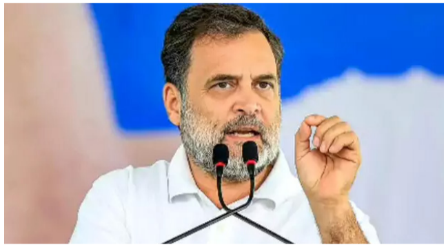
హైదరాబాద్. (డిడి9 వార్త):

కేంద్రం పై విరుచుకు పడ్డ రాహుల్ గాంధీ ఒకే కంపెనీ కోసం నిబంధనలు మార్చారని ఆరోపణ విద్యార్థుల భవిష్యత్తును లెక్క చేయట్లేదని విమర్శ ప్రధానికి తన ప్రభుత్వ మనుగడే ముఖ్యమని అగ్రహం అత్యంత కీలక నిబంధనకు పాతరేశారని ఆరోపణలు సీఎంఎంఐ నర్సిఫికేషన్ స్థాయిని లెవెల్ 3కి కుదించిన అధికారులు తప్పులు జరిగితే విధించే పెనాల్టీల రద్దు టీసీఎస్ ఉన్నా నిబంధనలు మార్చి కోఎంప్లై కే పట్టం కనిపించిన పేజీలు, మొరాయిస్తున్న వార్తల్లో ఉపాధ్యాయులు హెచ్చరించినా తొందరపాటుతో ముందుకెళ్లిన బోర్డు న్యాయ విచారణ జరపాలిందేనని పట్టుబడుతున్న రాహుల్ గాంధీ