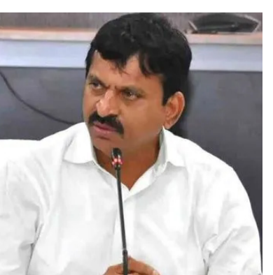
డిడి9 వార్త, హైదరాబాద్

భాగ్యనగరంలో లక్ష అభ్యుదయ ప్లాట్ల నిర్మాణం గృహనిర్మాణ శాఖ కీలక ఉత్సర్గులు లక్ష ప్లాట్ల నిర్మాణానికి ప్రభుత్వం గ్రీన్ సిగ్నల్ తొలి విడత సైట్ ప్రాజెక్టు కింద 12 వేలు గృహ నిర్మాణ శాఖ స్వమైన అనుమతులు అలాదాయ వర్గాల ప్లాట్లకు ఉచితంగా ల్యాండ్ పేర్ నిర్మాణ ఖర్చులో రూ.5 లక్షల భారీ సబ్సిడీ ప్రభుత్వ బడ్జెట్ నుండి లక్షలకు పోసింగ్ వోర్డు సొంత నిధులతోనే ప్రతిష్ఠాత్మక హోసింగ్ ప్రాజెక్టుల నిర్వహణ ప్రభుత్వ భూముల్లో నిర్మాణ స్థలాల గుర్తింపు భూముల ఎంపిక, బిల్డింగ్ వివాదాల పరిష్కారం వివిధ బాధ్యతలను హోసింగ్ వోర్డు పోషించిన ప్రభుత్వం